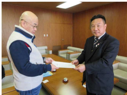
大治町に陳情を提出する舟橋先生（左）