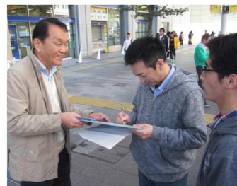
早く署名に協力する姿が

科医院に足が向かない。負担が軽くなったら通院・治療をしたい」、青年が「矯正治療が保険でできたらよい」と話すなど、窓口負担割合の引き下げや保険適用拡大を求める声が相次いで寄せられました。